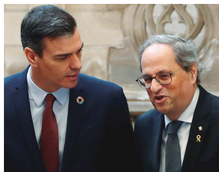
El president del Gobierno, Pedro Sánchez, i el de la Generalitat, Quim Torra, s'han compromès a posar en marxa la taula de diàleg entre Governos